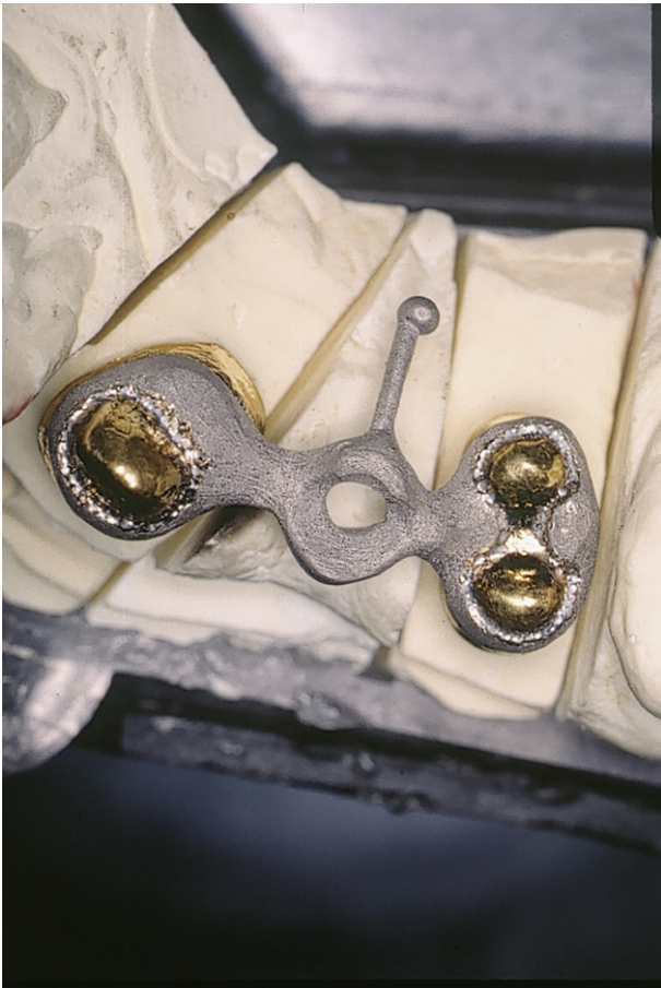
Fig 11(41): Cappette galvaniche saldate