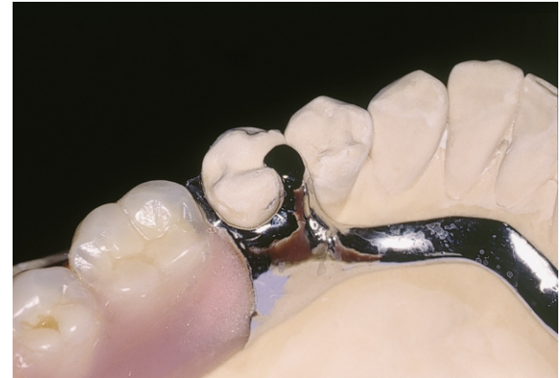
Fig 6(39): Scheletrato dopo della riparazione