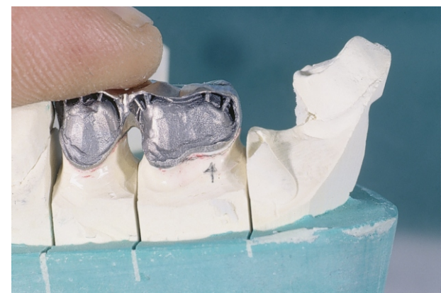
Fig 8(24): Cappetta con bordo ricostruito