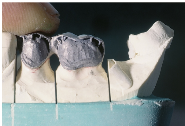
Fig 7(19): Cappetta con bordo da aggiungere