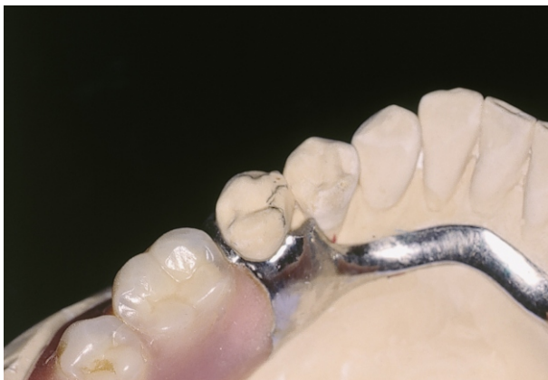
Fig 5(23): Scheletrato prima della riparazione