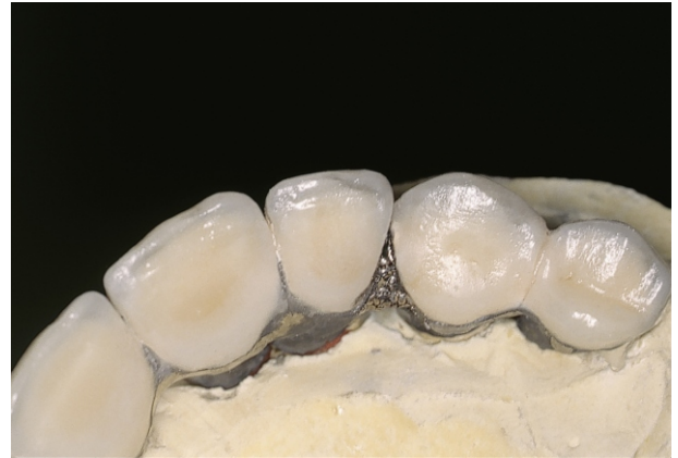
Fig 1(1): Saldatura di attacco