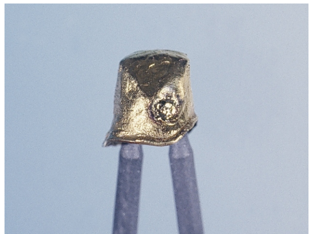
Fig 4(44): Cappetta galvanica dopo della riparazione