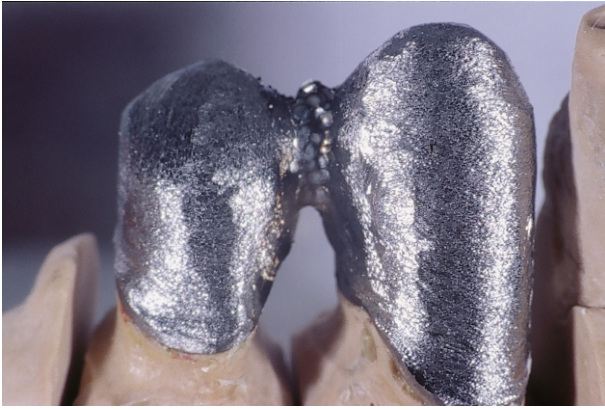
Fig 9(30): Cappette saldate