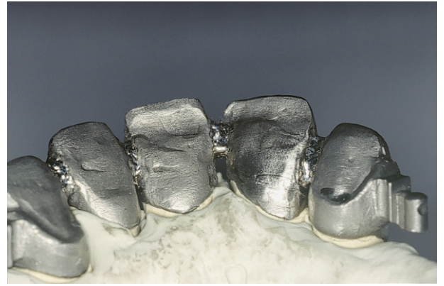
Fig 10(7): Cappette fuse in singolo con attacco già di fusione