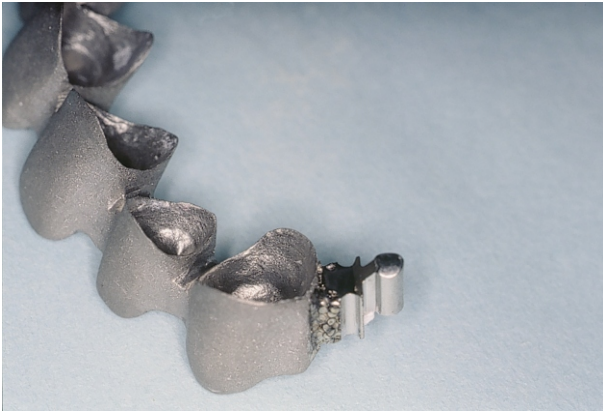
Fig 1(1): Saldatura di attacco